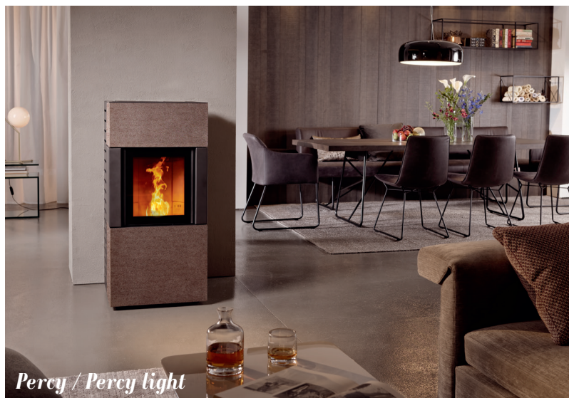
Percy / Percy light