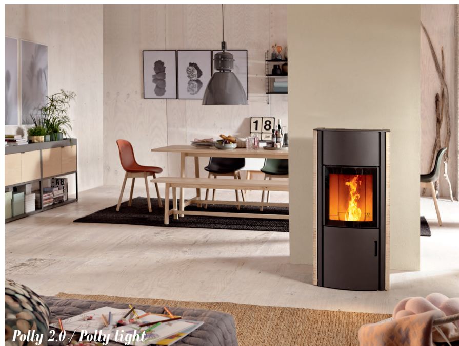
Polly 2.0 / Polly light